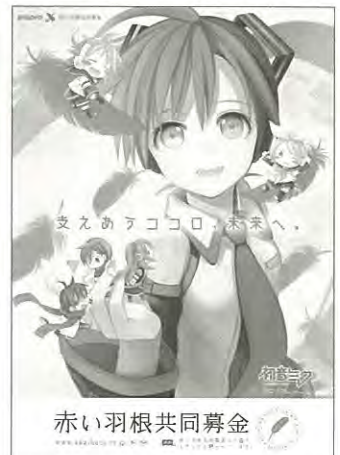
illustration by (kenji) ©Crypton Future Media, INC. www.piapro.net piapro