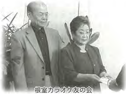
根室カラオケ友の会

平成25年6月1日から平成25年9月30日までに皆様から寄せられた善意を紹介いたします