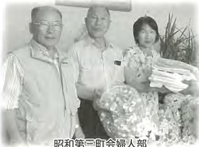
昭和第三町会婦人部