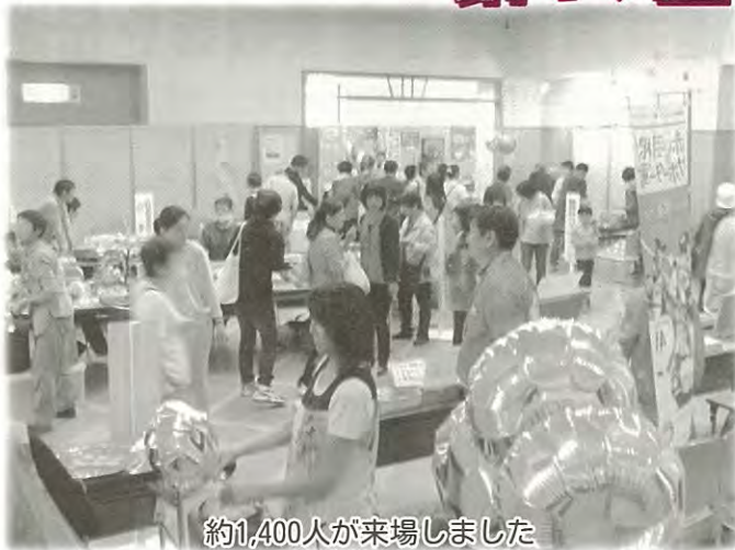
約1,400人が来場しました

9月8日(日)に根室市総合文化会館を会場に、「第19回ふれあい交流会」を開催しました。当日は小雨が降っておりましたが、屋内及び屋外の会場に設置された各コーナーでは、多くの来場者でにぎわい、みんなで楽しい一日を過ごすことができました。