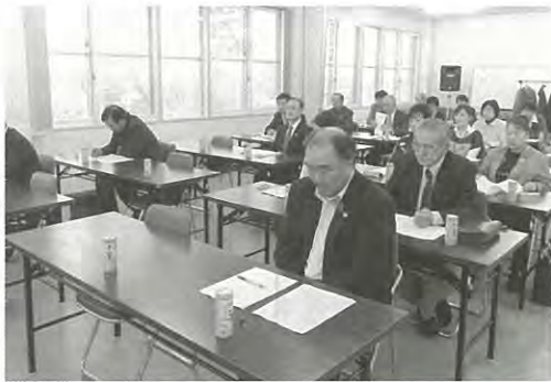
当日は、本会役職員及び市内の福祉施設職員など22名が研修会に参加しました。