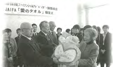
社生命保険ファイナンシャルアドバイザー協会釧路協会