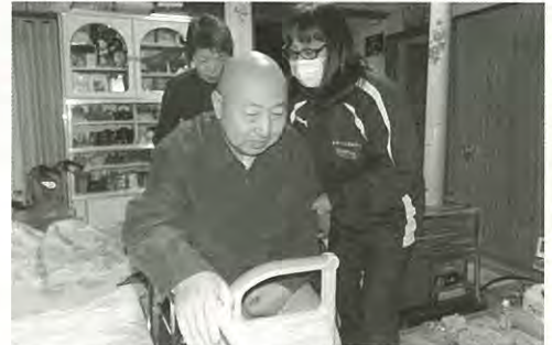
車イスからベッドへ移乗介助している様子