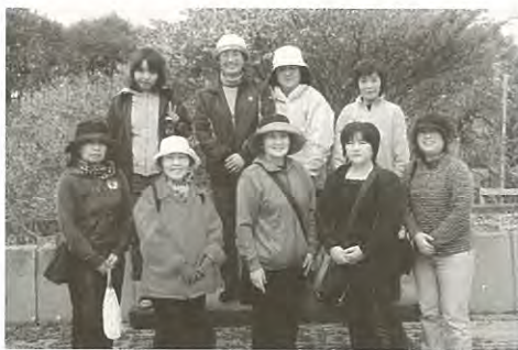
ろうあ会・手話の会合同の野外交流会

根室手話の会 は、「手話を学び、ろうあ者との交流を深めること。ろうあ者の社会生活における諸問題を考え、解決できるように努力すること」を目的に設立しました。会には「昼の部」と「夜の部」があり、根室市ろうあ会の協力と熱心な指導のもと、福祉会館を会場に定例学習会（例会）を行っています。