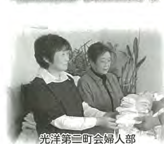
光洋第二町会婦人部