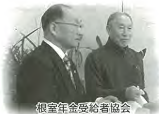
根室年金受給者協会