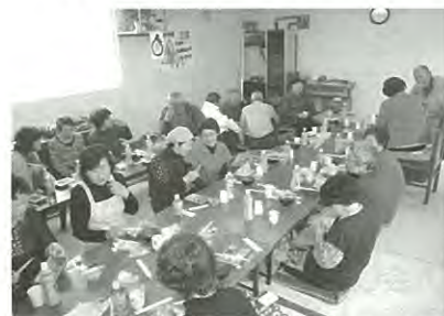
【松本町会でふれあいサロンを実施】

身近な地域で誰もが生きがいを持って安心して暮らすことができる地域づくりを目指し、「見守り活動」、「ふれあいサロン」、「災害時の体制づくり」などの福祉活動に取り組む町会に対して助成金を交付しました。