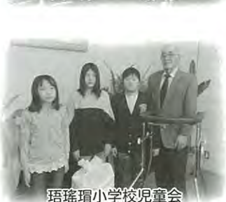
瑠璃瑠小学校児童会