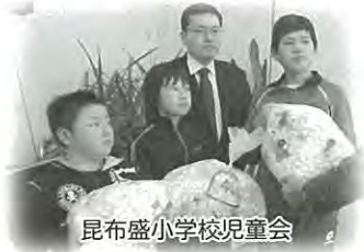
昆布盛小学校児童会