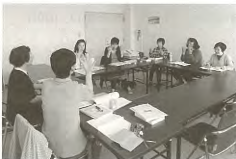
定例学習会（昼の部）