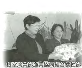
根室湾中部漁業協同組合女性部