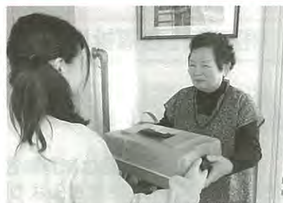
【お弁当をお届けしました】

お昼に栄養バランスのとれたおいしいお弁当を自宅に届けます。その際、配食スタッフが、利用者に声かけなどを行い、安否の確認をします。昨年度は、78人が配食サービスを利用し、7,434食のお弁当と安心を届けました。