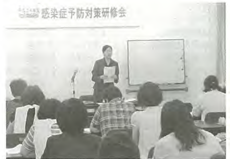
【『感染症予防対策研修』を受講】

さらに、ホームページで社協情報をタイムリーに発信するなど、広報活動の強化に努めます。