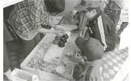
【ふれあい交流会“金魚すくいコーナー”】

毎年、根室市総合文化会館を『ふれあいの場』とし、誰もが共に生きる福祉の社会づくりを目指して『ふれあい交流会』を開催しています。今年も9月に開催を予定しております。当日はゲームコーナーやバザーコーナーなど多くのイベントを予定しておりますので、皆様のご来場をお待ちしております。