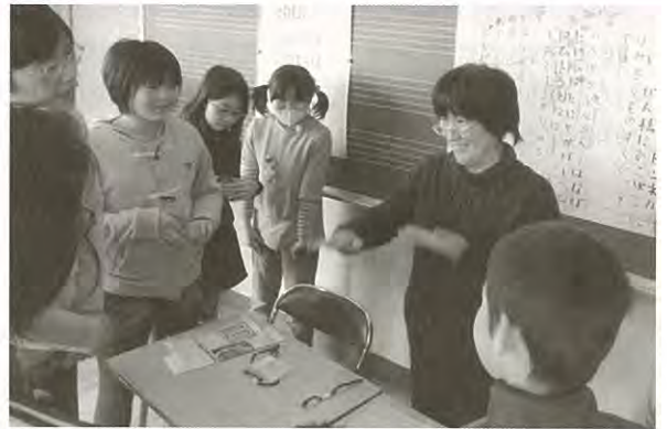
ジュニアボランティア養成講座（手話の学習）

随時会員を募集していますので、聴覚障害のある方、ぜひ入会して交流しませんか？手話ができなくてもかまいません。お待ちしております。