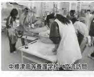
中標津高等養護学校へ交流訪問