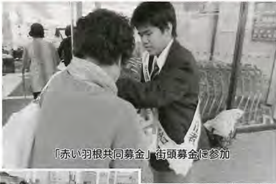
「赤い羽根共同募金」街頭募金に参加