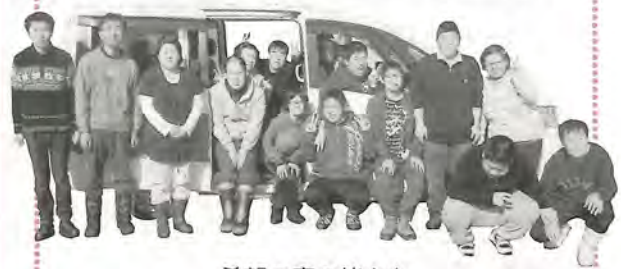
希望の家の皆さん