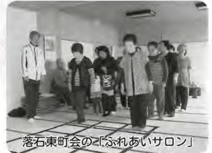
落石東町会の「ふれあいサロン」