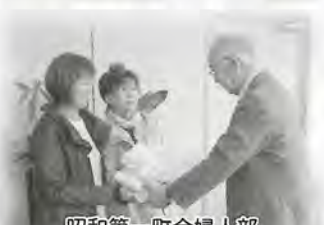
昭和第一町会婦人部