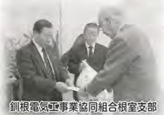
釧根電気工業協同組合根室支部