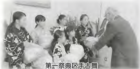
第一祭典区手古舞