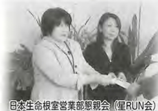
日本生命根室営業部懇親会(星RUN会)