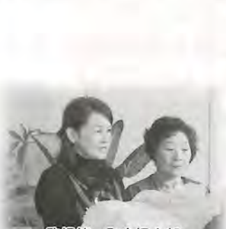
駒場第一町会婦人部