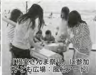
「根室さんま祭り」に参加 (子ども広場：風船アート)

根室高校ボランティア局は、平成11年に設立して以来、さまざまなボランティア活動に取り組んできました。