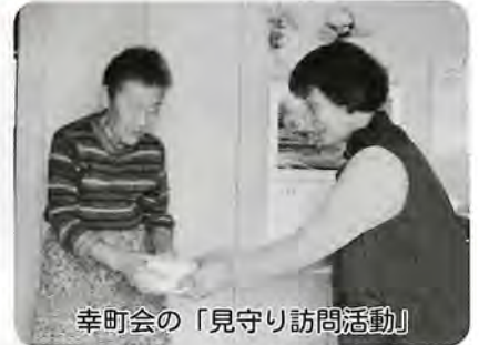
幸町会の「見守り訪問活動」

※ふれあいサロンについて、町内会館などの集会施設が近くに無く、会場の確保が難しい町会については、お気軽にご相談ください。